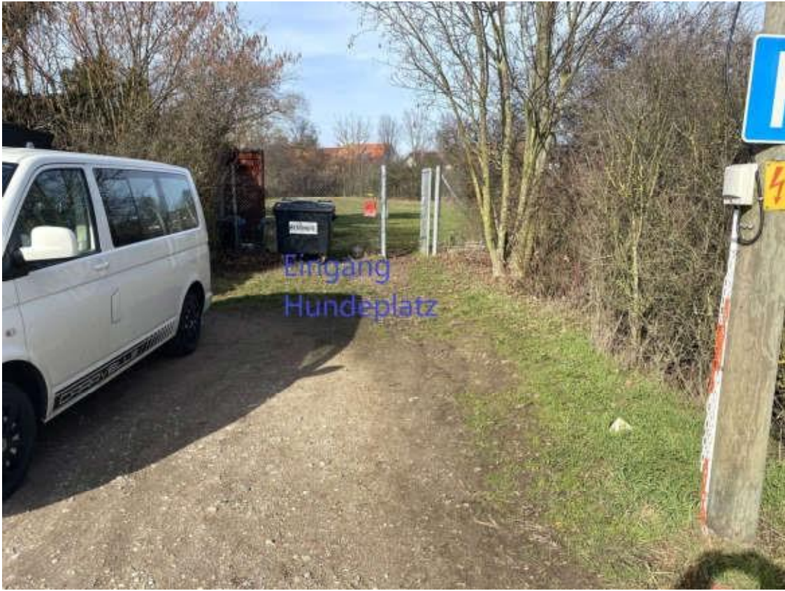
Weg zur Anmeldung erfolgt über Einbahnstraßensystem über separaten Weg